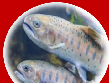
サクラマス釣り堀 (ヤマメ)