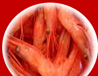
紅エビ早剥き大会