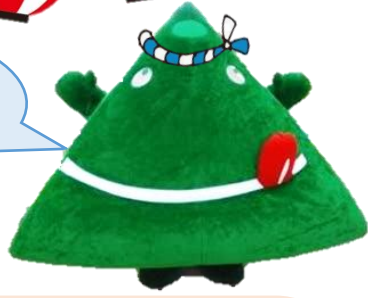
おいしい山形推進機構 ゆるキャラ「ペロリン」