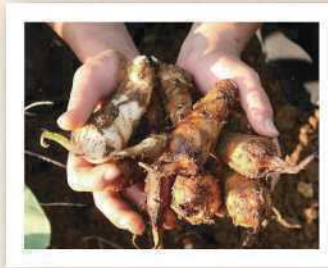
じんごえもんいも 甚五右エ門芋

室町時代から佐藤家で受け継がれてきた一子相伝の里芋。普通の里芋よりも子芋、孫芋が細くなり、ぬめりが多く柔らかい。親芋も柔らかく食べられる。