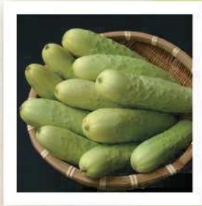
かんじろうきゅうり 勘次郎胡瓜

黄緑色でずんぐりしていて水分豊富。生食に適している。ピクルスにしても色が綺麗なまま変わりにくい。