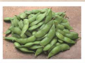
じんだいまめ 神代豆

【所在地】〒996-0024 山形県新庄市多門町1-2 【TEL】0233-28-8886 【FAX】0233-28-8887