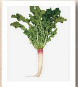
ひじおりだいこん 肘折大根

【保存方法】常温 【供給時期】10月下旬～11月中旬 【希望小売価格】300円/kg ※1kgあたりおよそ1.5本