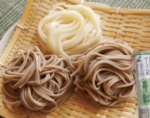
ワーコム米そば(左)・ワーコム米うどん(中央) ・真室川そば(右)